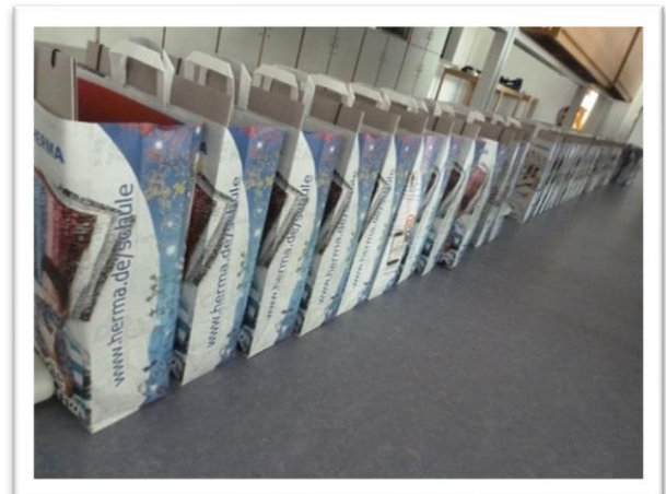
Fotos 2 und 3: Gepackte Flinke pinke Schulpakete warten auf ihre Besitzer