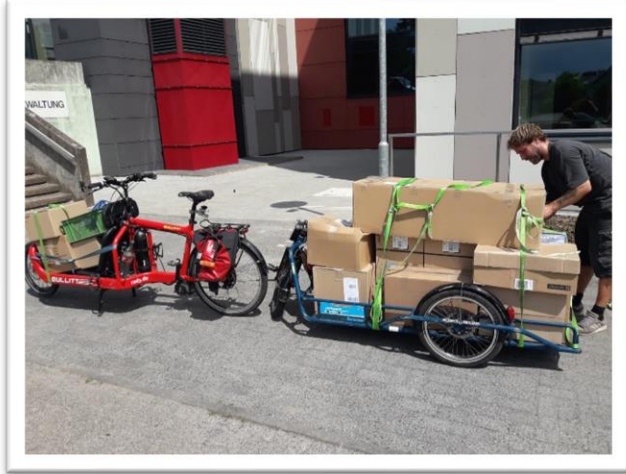
Foto 4: Die umweltfreundlichen Schulmaterialien werden vom Fahrradkurier geliefert

In diesem Schuljahr kam als besonderes umweltfreundliches I-Tüpfelchen hinzu, dass die Schulmaterialien der Firma „Schreibwaren – Baehr“ per Fahrradkurier „RadKu“ aus Marburg zu uns geliefert wurden. (siehe Foto 4). Die Pakete wurden in der ersten Schulwoche nach den Sommerferien an alle Kinder verteilt, die ein „Flinkes Pinkes“ Schulpaket bestellt hatten.